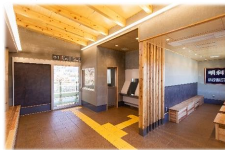
対象事例の一例 (駅舎の木造・木質化)