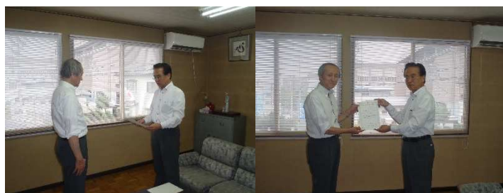
＜当日、授与式の風景＞